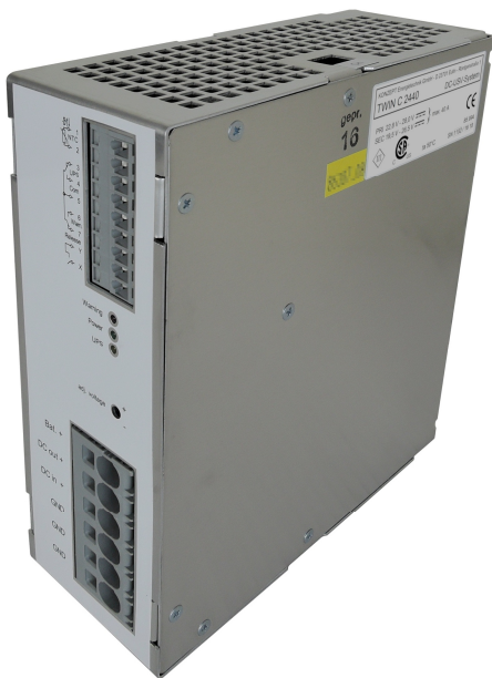
TWIN C 2440

The TWIN C 2440 DC-UPS module is designed for industrial applications and is available in 24 V DC 5 A, 10 A, 20 A and 40 A version. Thanks to the compact design and the different performance classes, there are many application possibilities for these UPS modules, which meet the high safety and EMC requirements. The modular design and the interconnection of an external battery and a power supply, such as the BEK, gives you the optimal solution for an uninterruptible 24 V DC system.